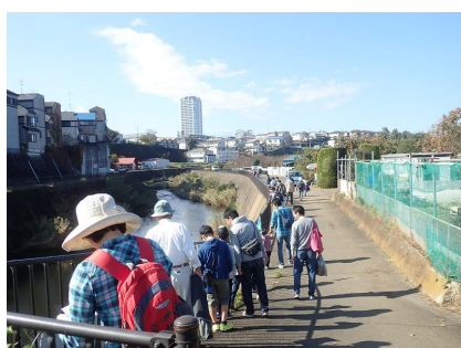
恩田川に沿って歩く