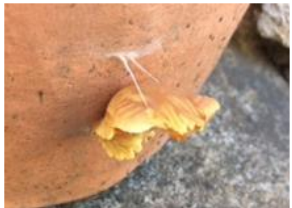
植木鉢にくっついて越冬するさなぎもいる