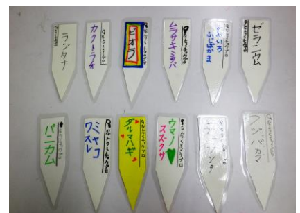
お花のネームプレート